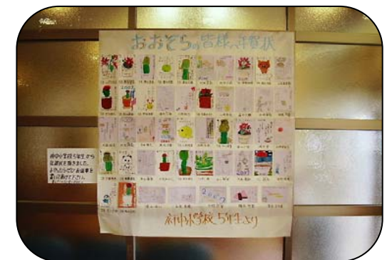
(府中小学校5年生からの年賀状)

昨年、交流のあった府中小学校5年生から 年賀状がとどきました。 心温まる年賀状の数々・・・ 本当にありがとうございました。