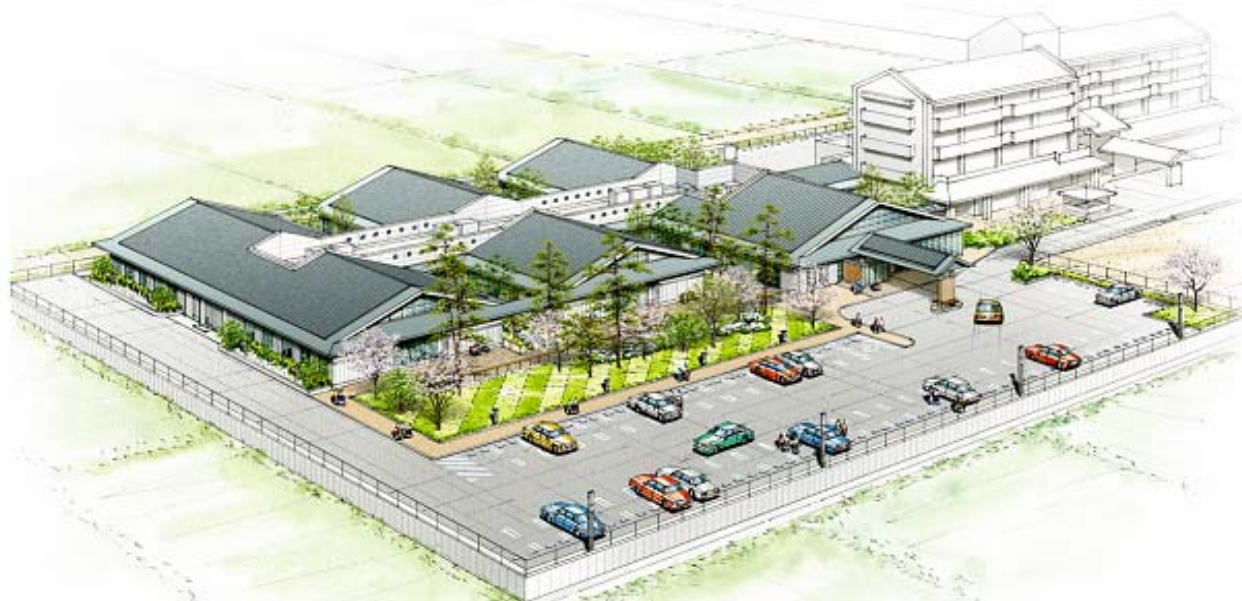
(仮称) 特別養護老人ホーム「おおぞら」整備工事